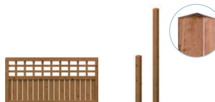
Art. 1323 178 x 89 cm 89,00