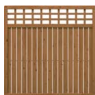
Art. 1320 178 x 178 cm 119,00