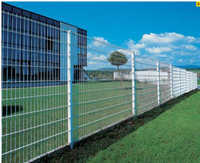
5. adronit®-Gitterzaun ECO I

Die Farbe bestimmen Sie Eine umfangreiche Farbpalette ermöglicht die harmonische Anpassung der Gitterzäune ECO I und II an das Gebäude und Grundstück. Dazu stehen Ihnen vier Standardfarben I (s.u.) ohne Aufpreis zur Verfügung. Weitere RAL-Farbtöne sind auf Wunsch gegen Aufpreis erhältlich.