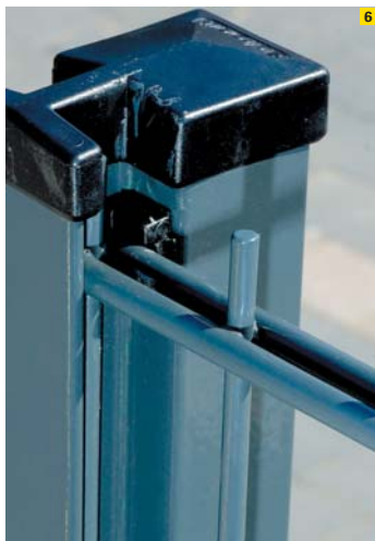
6. Detail: Befestigung des Gitters am Pfosten

Die in diesem Prospekt enthaltenen Informationen sind unverbindlich. Für Ausführung und Lieferumfang ist allein die technische Spezifikation unserer Angebote maßgebend. Technische Änderungen bleiben vorbehalten.