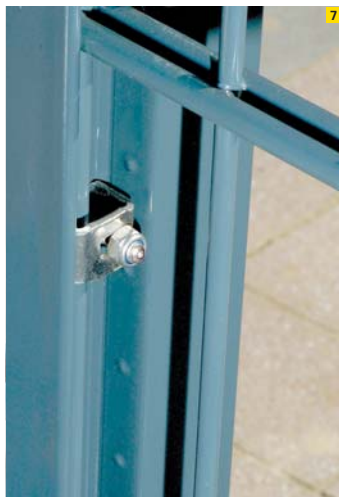
7. Detail: Diebstahlschutz durch Sicherungs-U