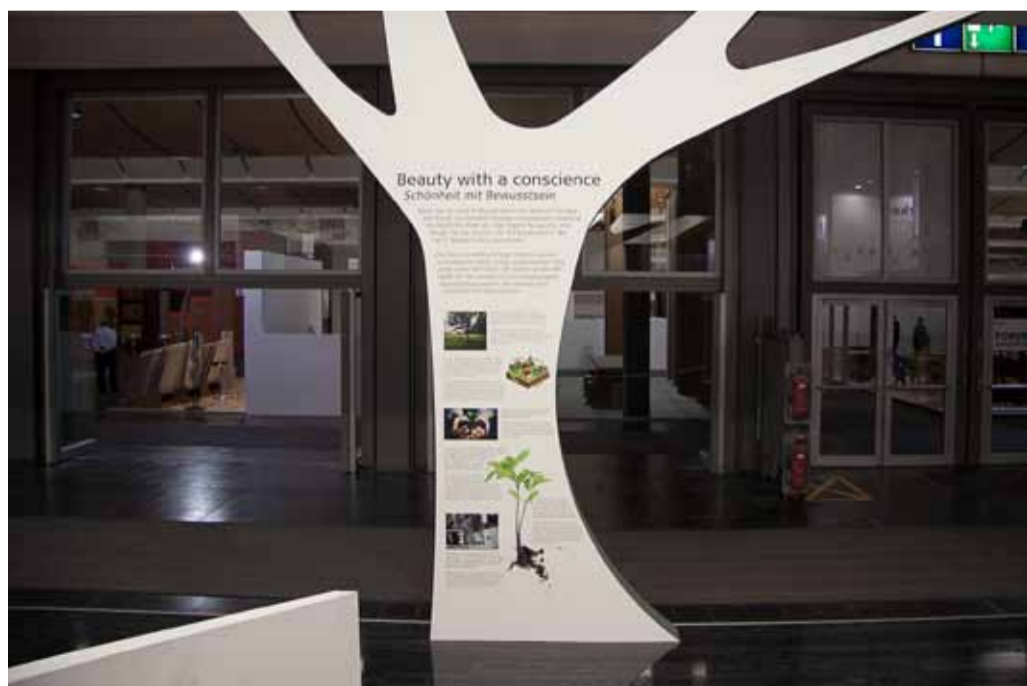
Schönheit mit Bewusstsein: Das Herz von Kährs schlägt mitten in einem schwedischen Wald. Das prägt das Verhalten und verleiht großen Respekt vor der Umwelt und ein ausgeprägtes Qualitätsbewusstsein.