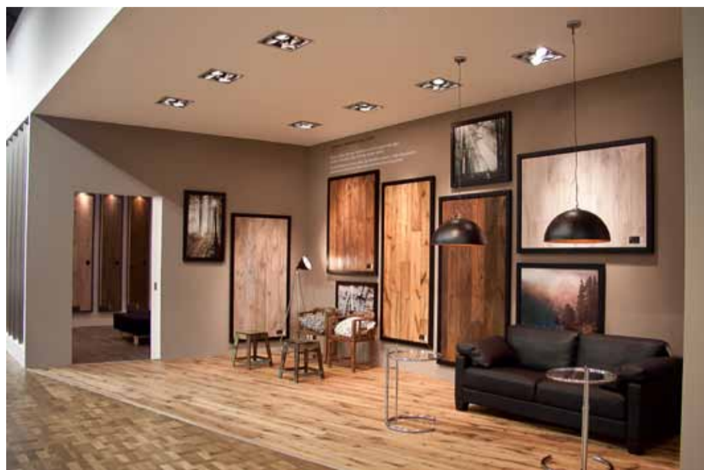
Kährs Arbusto Collection: Das Bindeglied zwischen Artisan und Da Capo: Besonders lebendige Altholzdielen mit Riverstone Handhobelung.