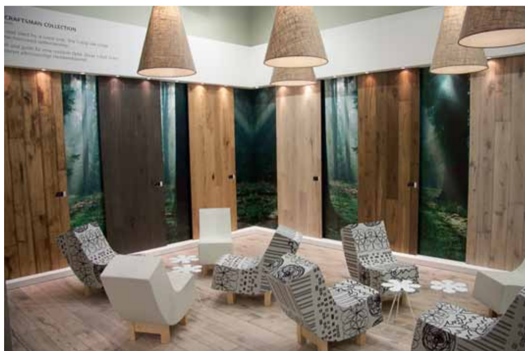
Kährs Craftsman Collection: Gehobelt und geölt für eine rustikale Optik. Diese 1-Stab Eiche Dielen zelebrieren altehrwürdige Handwerkskunst.