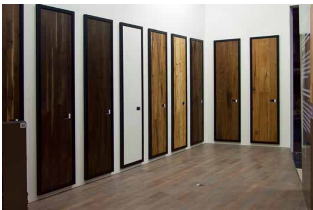
Kährs Kollektionsergänzungen: Viele neue Produkte runden das sehr erfolgreiche Sortiment von Kährs zukünftig noch weiter ab.