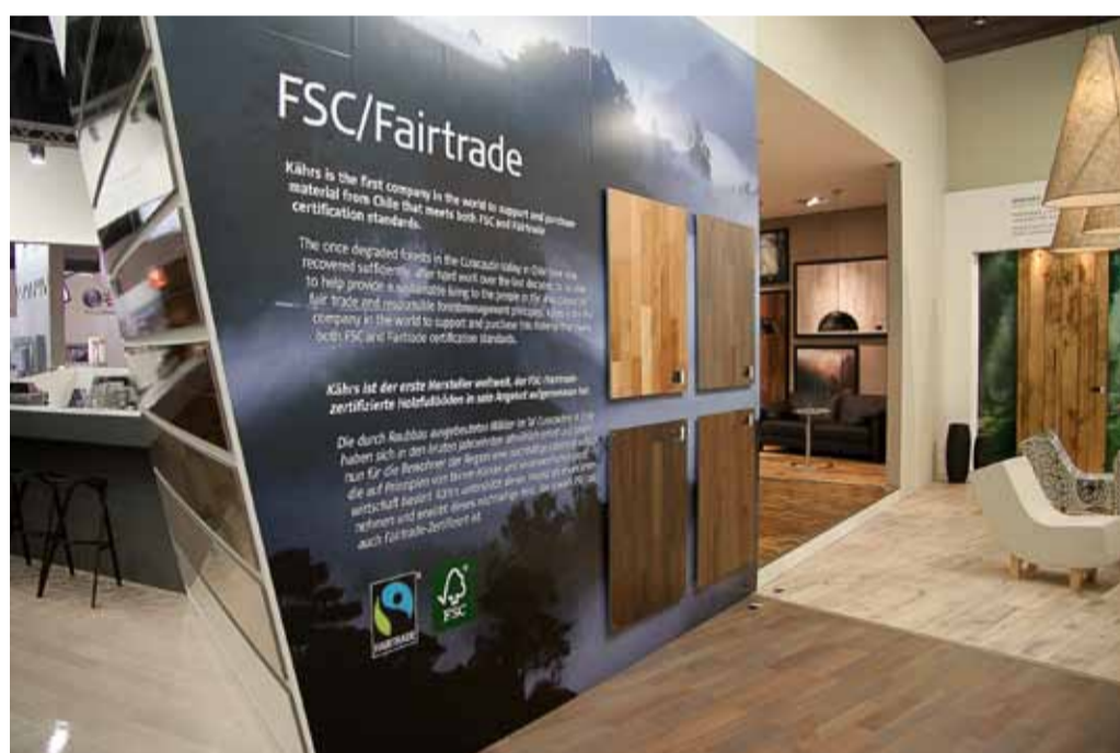
FSC/Fairtrade: Kährs ist der erste Hersteller weltweit, der FSC-/Fairtrade-zertifizierte Holzfußböden in sein Angebot aufgenommen hat.